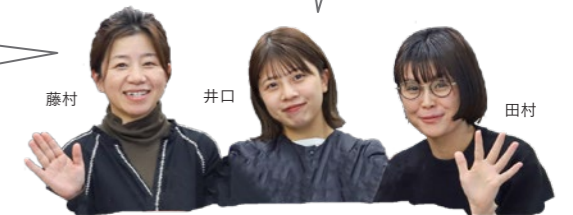
コーディネーターチーム

いる・いないを分ける、必要なもの選ぶ基準はなんなのでしょうか。それが片づけの準備運動です。家族と一緒に暮らす上で何を大切にしたいか。その家の中でどんなふうに過ごしたいか。そのためには何が必要か、いらぬものは何か。その基準を決めること、思考の整理を行うことが一番下の大切な部分だと思います。